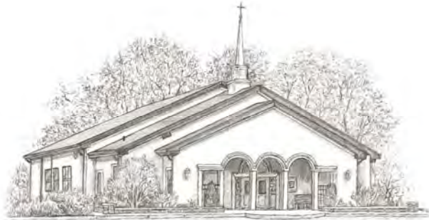
ST. ANTHONY CLARET