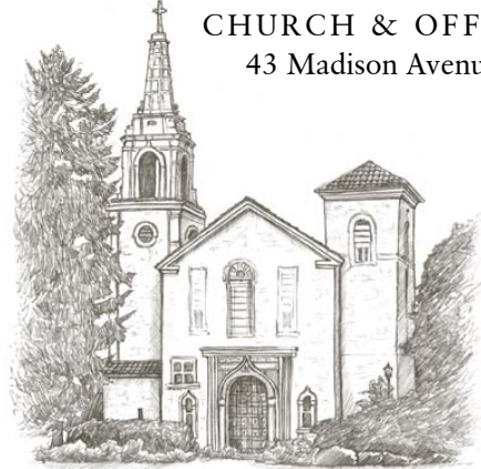
ST. MARY OF THE LAKE (SML)