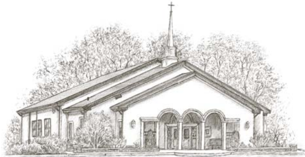
ST. ANTHONY CLARET (SAC)