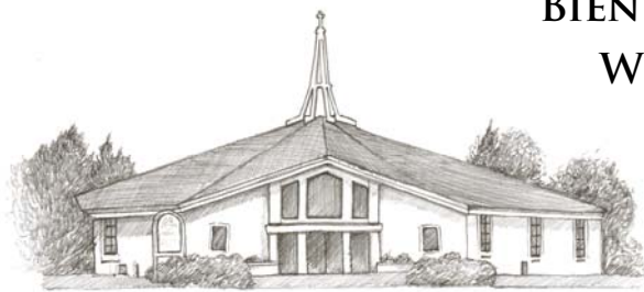
HOLY FAMILY CHURCH (HF)