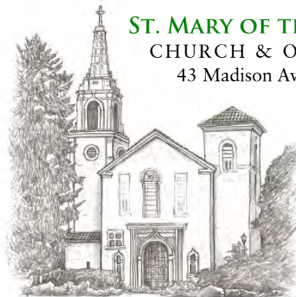
ST. MARY OF THE LAKE CHURCH & OFFICE 43 Madison Avenue