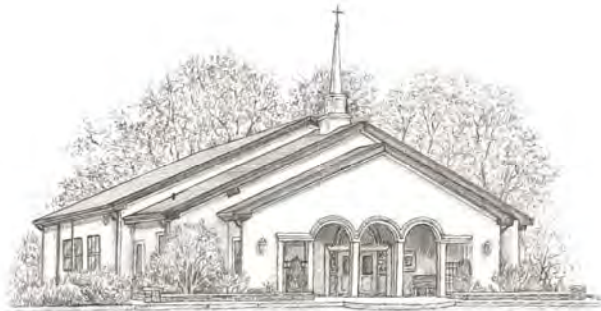
ST. ANTHONY CLARET (SAC)