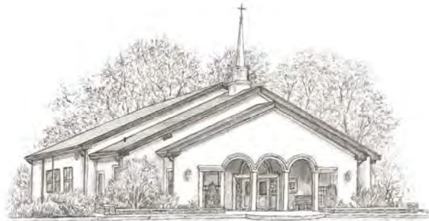
ST. ANTHONY CLARET (SAC)