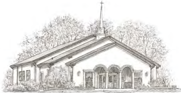
ST. ANTHONY CLARET (SAC)