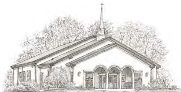
ST. ANTHONY CLARET