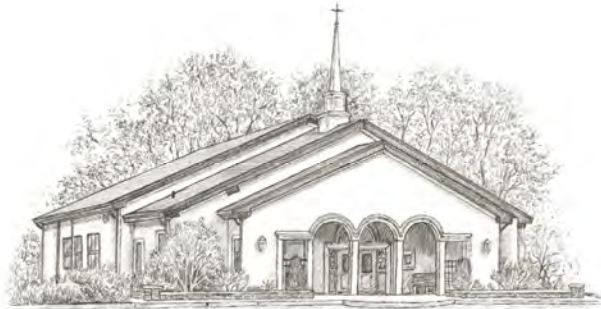
ST. ANTHONY CLARET