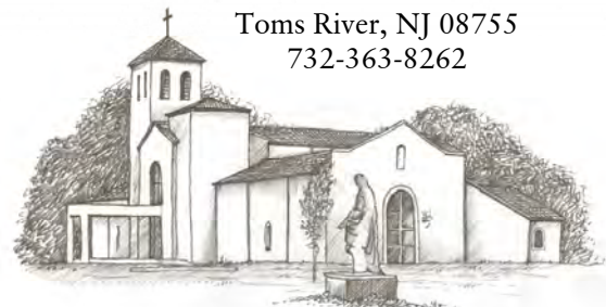
CEMETERY & MAUSOLEUMS