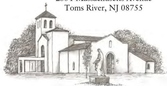
CEMETERY & MAUSOLEUMS