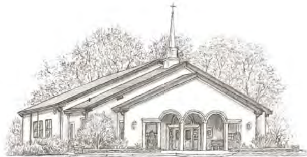
ST. ANTHONY CLARET (SAC)