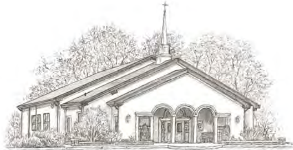
ST. ANTHONY CLARET