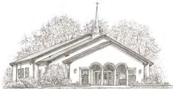
ST. ANTHONY CLARET (SAC)