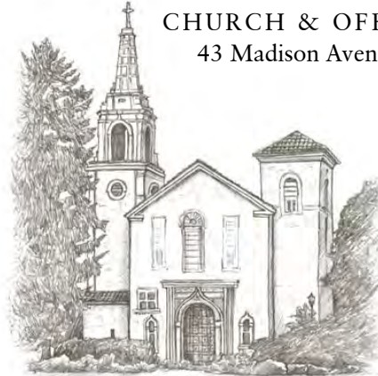
ST. MARY OF THE LAKE (SML)