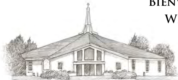
HOLY FAMILY CHURCH (HF)